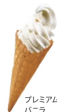
プレミアム バニラ