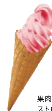
果肉入り ストロベリー