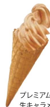
プレミアム 生キャラメル