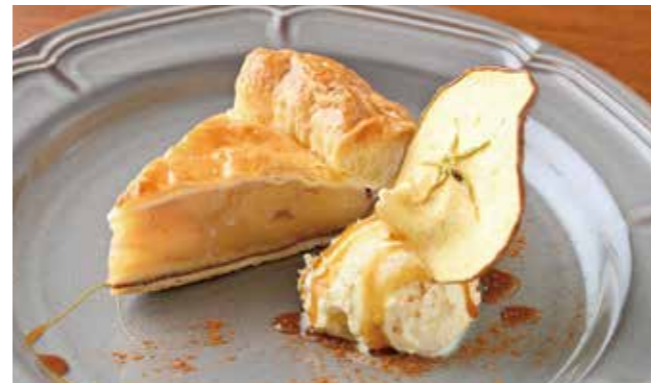
りんごがぎっしりつまったアップルパイに 濃厚ミルクのアイスクリーム、キャラメルソース。 ¥700