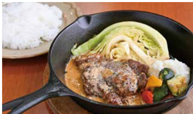
国産ポークの肩ロースステーキ肉を 岐阜産本みりんと醤油のソースで仕上げました。 美濃加茂産ハツシモのライス付き ¥1,300