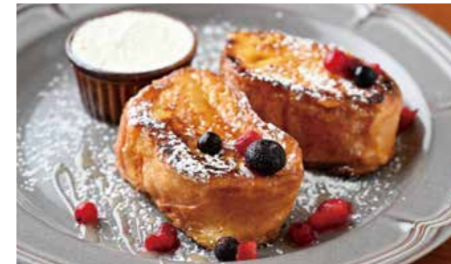
フレンチトーストに 園内でとれたハチミツをトッピング、 特製ホイップバターを添えて。 ¥800