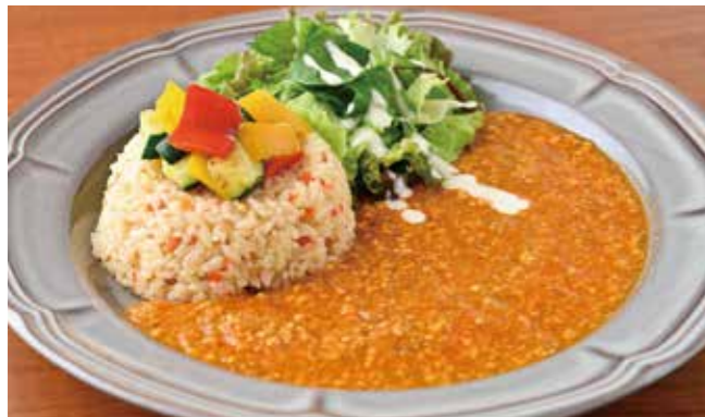
インドカレーの人気店「ラサマンダ」のキーマカレー。 美濃加茂産ハツシモ・にんじん・玉ねぎの バターライスと一緒に。 ¥1,100

大きなハンバーグのロコモコ にんじん・玉ねぎのバターライス TAKE OUT OK 容器代 +¥50