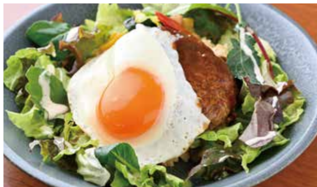
デミグラスソースの大きなハンバーグと目玉焼き、 美濃加茂産ハツシモ・にんじん・玉ねぎの バターライスに野菜をトッピング。 ¥1,100

大きなハンバーグのロコモコ にんじん・玉ねぎのバターライス TAKE OUT OK 容器代 +¥50