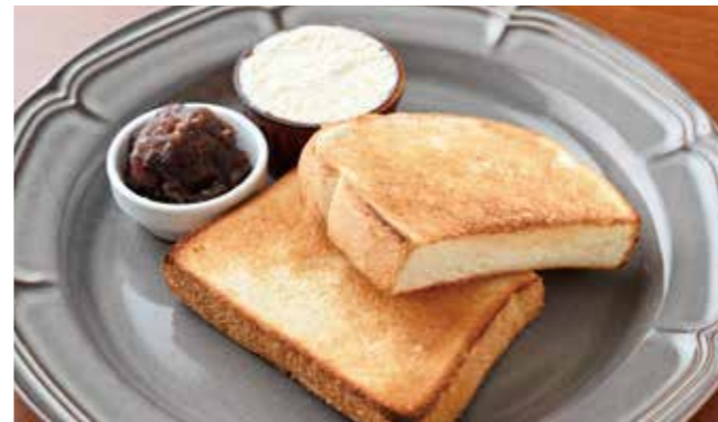
ご当地の人気トースト。 小倉あんの特製ホイップバターが とってもよく合います。 ¥400