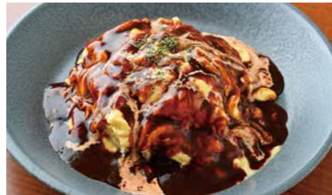
八百津産こだわりのたまごと 美濃加茂産ハツシモ・にんじん・玉ねぎの バターライスに濃厚デミグラスソース。 ¥1,100

八百津産こだわりのたまごの ふわとろデミグラオムライス TAKE OUT OK 容器代 +¥50