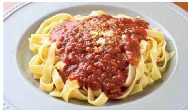
牛ミンチがゴロゴロ入った トマト風味のソースと コシのあるフィットチーネがよく合う本格パスタ。 ¥1,100

牛ミンチゴロゴロボロネーゼ フィットチーネ TAKE OUT OK 容器代 +¥50