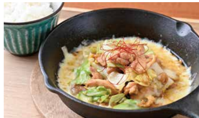
岐阜県のソウルフード「鶏ちゃん(味噌ダレ)」と キャベツを炒めてチーズをトッピング。 美濃加茂産ハツシモのライス付き ¥1,200

八百津産こだわりのたまごの ふわとろデミグラオムライス TAKE OUT OK 容器代 +¥50