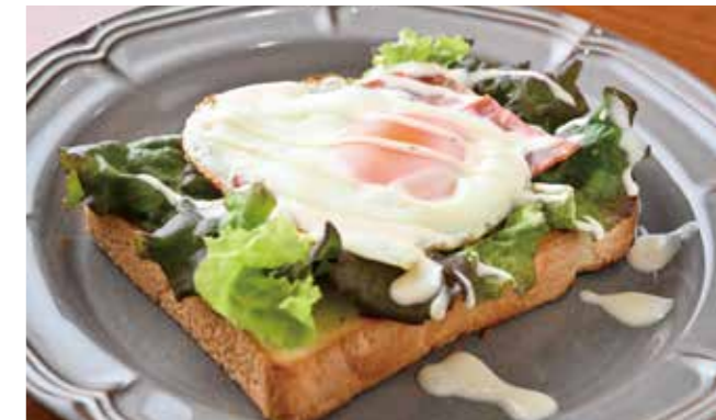
バタートーストに、サニーレタス、 塩・こしょうしたベーコン、目玉焼きをトッピング。 ¥550